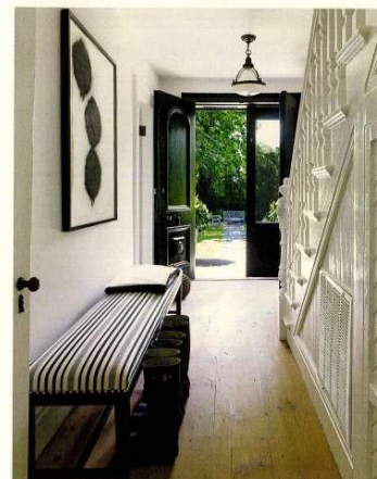
Linke Seite: Mitten im riesigen Garten mit alten Eiben und Apfelbäumen steht das mit Schindeln gedeckte Landhaus. Oben: Den Flur ziert eine mit Streifenstoff von C&C Milano bezogene Bank aus Frankreich. Die Lithografie darüber ist von Donald Sultan